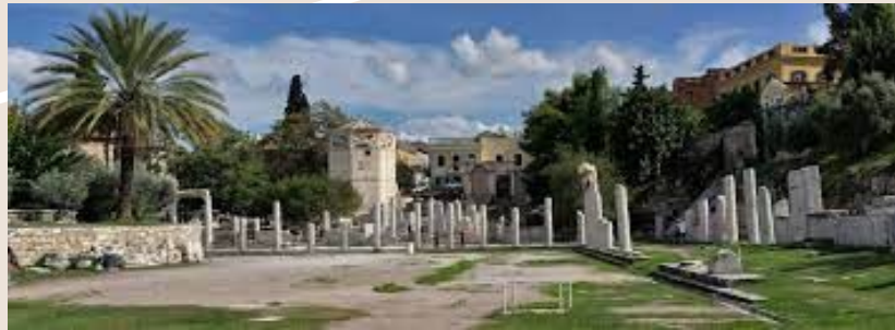
ΡΩΜΑΙΚΗ ΑΓΟΡΑ ΤΗΣ ΑΘΗΝΑΣ

Το 267 π.Χ. με την επέλαση των Ερούλων η πόλη υπέστη σημαντικές καταστροφές. Κάηκαν πολλά δημόσια κτήρια, λεηλατήθηκε η κάτω πόλη και καταστράφηκε μέρος της Αγοράς και της Ακρόπολης. Μετά την επίθεση, ένα μεγάλο μέρος των τειχών της πόλης χτίστηκε αναγκαστικά στη βόρεια πλευρά, αφήνοντας εκτός των τειχών ένα μικρό μέρος της Αγοράς. Η Αθήνα παρέμεινε το κέντρο της εκπαίδευσης και της φιλοσοφίας κατά τη διάρκεια των 500 ετών της ρωμαϊκής κυριαρχίας, ενώ πολλοί αυτοκράτορες όπως ο Νέρων και ο Ανδριανός προχώρησαν στην κατασκευή μεγάλων έργων για την πόλη.